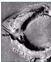
МАРС. Доказательства наличия вода