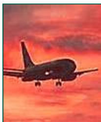
Boeing разрабатывает умную ракету