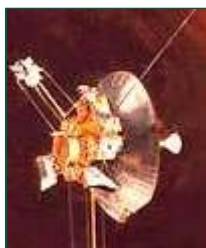
Деньги из мусора